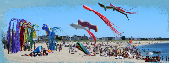
La Turballe plage